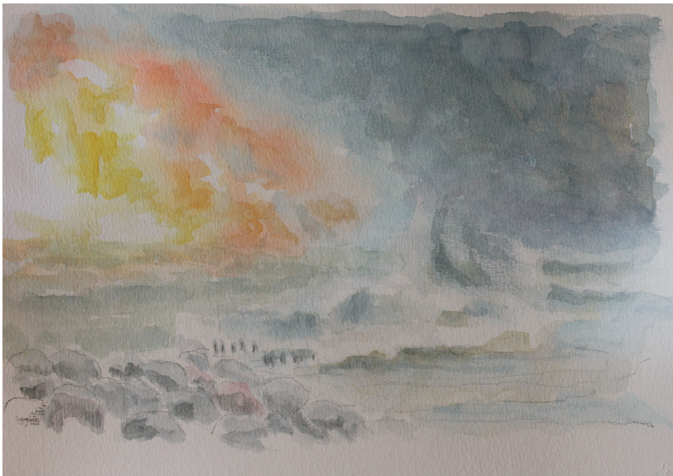
5.1. Korsør Revspids når det er værst – eller bedst.