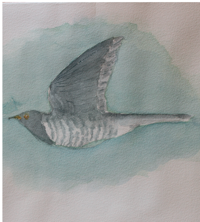
5.2. redesnylteren gøgen er her også.

Det blev her , at den ene ende af Storebæltsbroen blev landfast. Et mægtigt byggeri af tunnel og bro