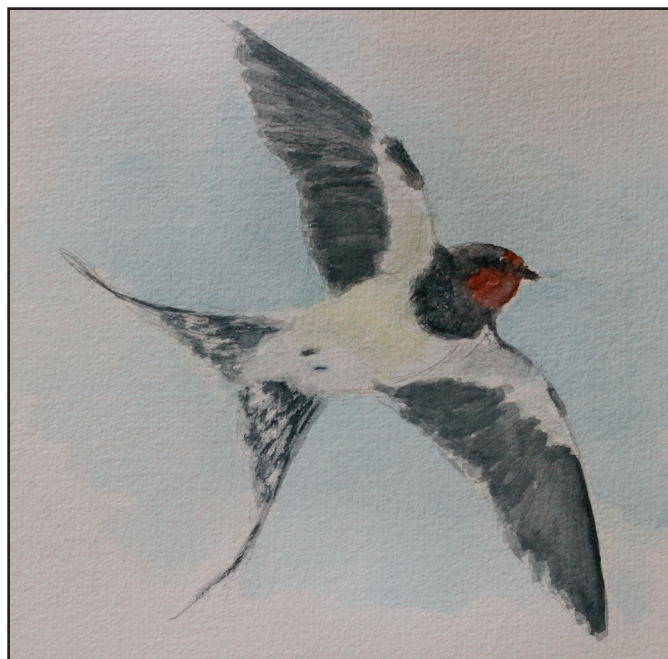
5.5. Landsvalen. Utrolig elegant og nærmest i smoking. Hannens lange yderste halefjer indikerer en stærk fugl, derudover ualmindelige er god til at manøvrere og skaffe føde. Drømmefuglen for en hun.

Nattergalen er stadig i fuld sang derovre i det tætte krat.