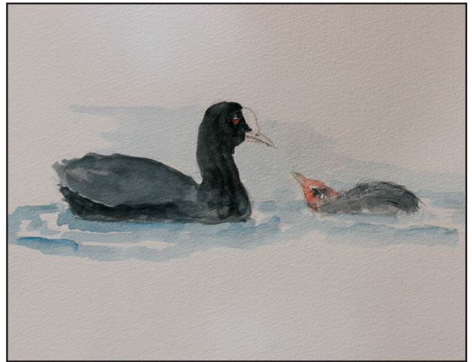
5.3. Blishønen er tidligt på færde med sit første af flere årlige kuld.

Fuglenes bygning indikerer, hvor de søger føde. Dykænderne under vand. Svømmeænderne i