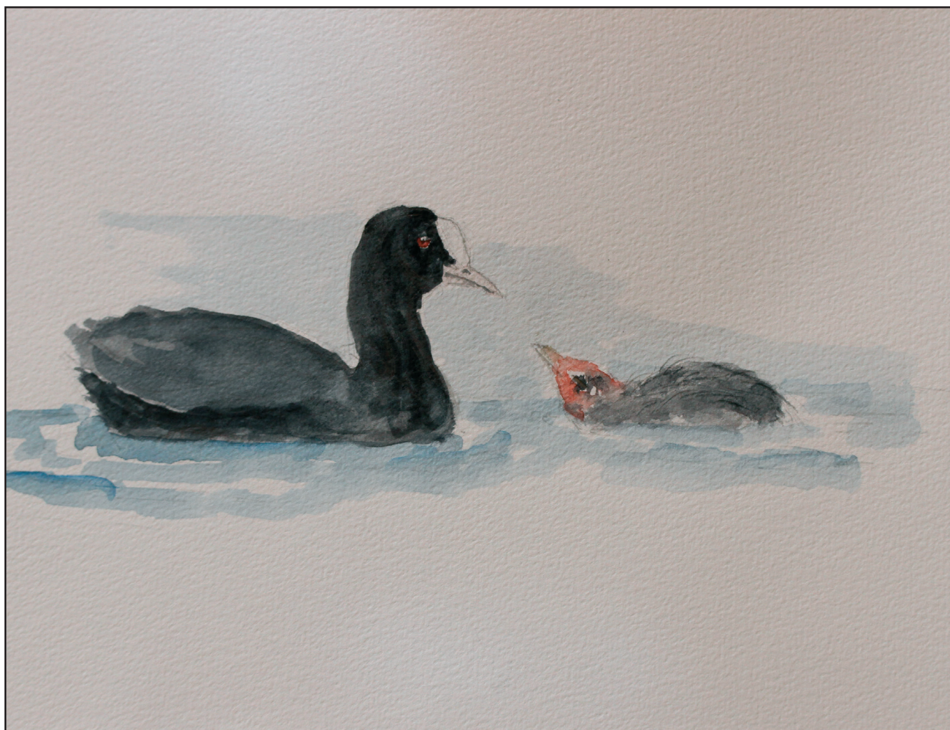
Blishønen er tidligt på færde med sit første af flere årlige kuld.