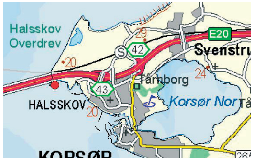
Oversigtskort. Den store røde prik viser turens udgangspunkt.